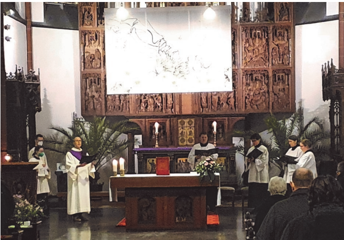
Text und Foto: Christa Thomaßen

Sonntag, 19.06., 19 Uhr St. Cornelius (Vokalquartett Kempen)